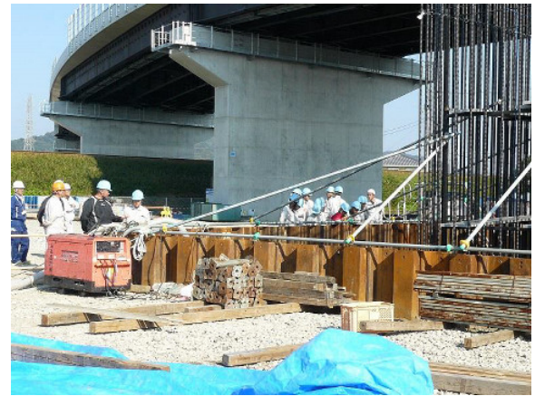
④工事名：H29 徳土 徳島小松島港(津田地区) 徳・津田海岸 築堤工事(2)／徳島県