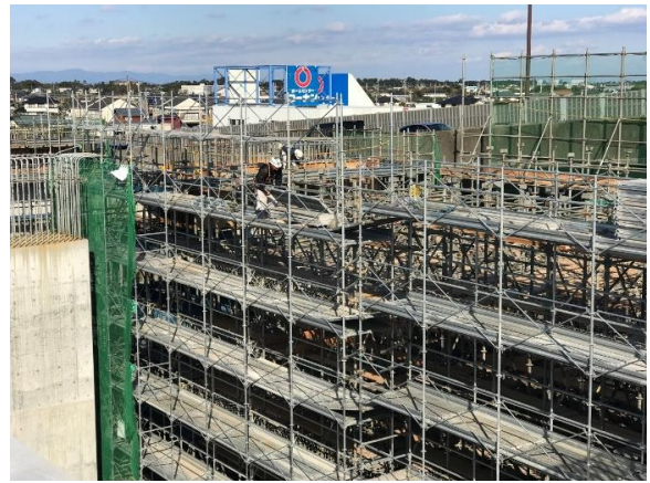
④工事名：H29 阿土 富岡港南島線 阿南・辰己 道路改良工事(1)／徳島県