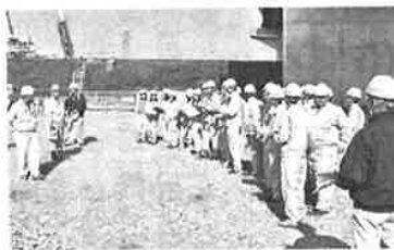
岸築堤工事現場ではICT技術活用について現場責任者からの説明に熱心に耳を傾けていた。環境土木コースの坂東

波おどり空港旅客ターミナルビル増築工他工事のうち建築工事(島谷建設・北島建設・平山建設JV)、「徳島小松島港(津田地区)徳・津田海岸築堤工事(2)(施工・吉田建工)」の5現場を見学した。 午後から見学した江田高架橋下部工事「写真」では生徒が2班に分かれて型枠の施工や溶接の現場を見学した他、津田海