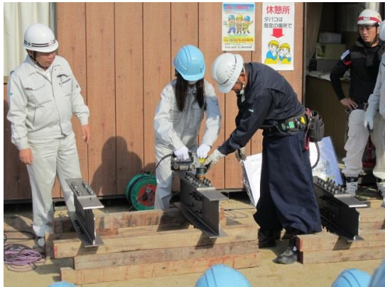
女子もボルト締め！