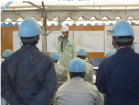
卒業生(先輩)あいさつ