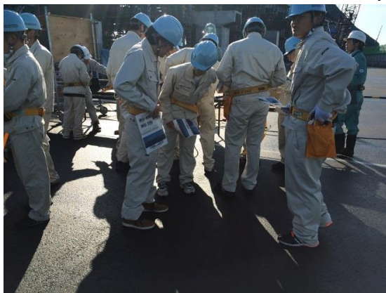
安全帯を着けて橋上部へ