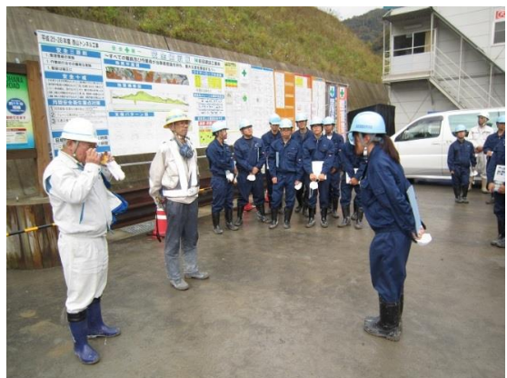
発破 3 分前！退避・・・その後発破を体験！