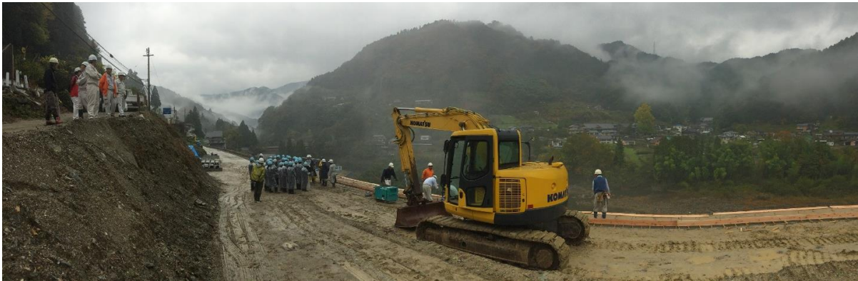
工事概要の説明&現場見学