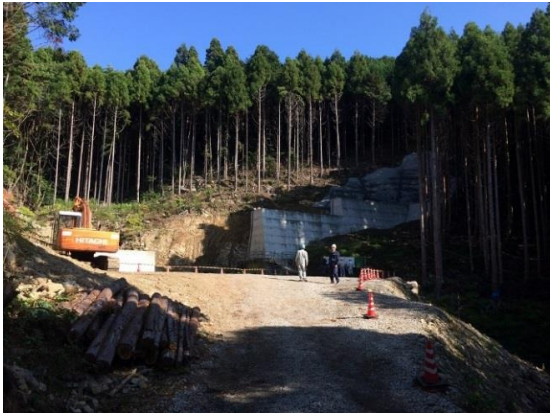
○工事名：道路改良工事（橋梁上部工事） 出合大橋上部工