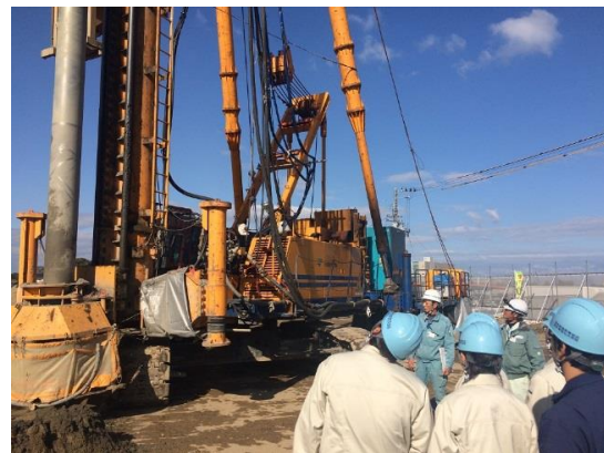
緩衝孔設置作業見学