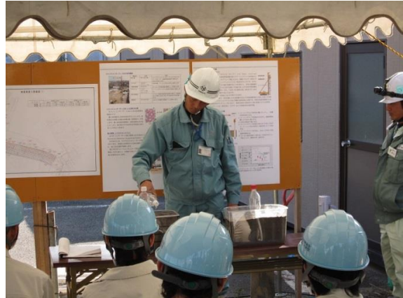
地盤改良効果の簡易実験