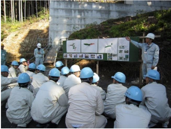
○工事名：H26 波土 山王谷 美波・日和佐浦 砂防工事