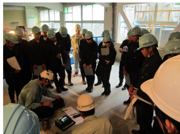
ひび割れ検査装置